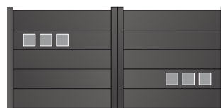
207.141 Carré 70 x 70mm 207.153 Carré 120 x 120mm 207.140 Carré 180 x 180mm