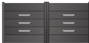
207.145 Trapèze 430 x 40mm