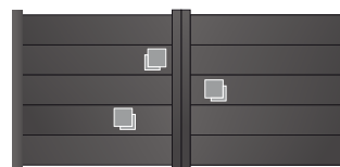
207.146 Carré double 150 x 150mm