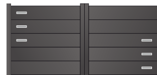
207.142 Rectangle 215 x 40mm 207.143 Rectangle 430 x 40mm