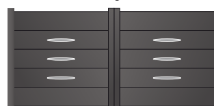
207.144 Ovale 435 x 40mm