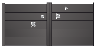
207.147 Petite feuille d'érable PS 207.148 Grande feuille d'érable PS