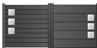
207.154 Hublot verre dépoli